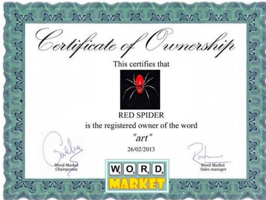
Red Spider, propietario de la palabra "Art" y el certificado de propiedad personalizado (Word Market).

El valor de las palabras se determina mediante un algoritmo que tiene en cuenta el tipo de terminología, el número de letras que contiene y cuál es el trend (tendencia) en el momento de su adquisición. Dado que este último dato cambia constantemente, también el valor de las palabras, como cualquier otro título, registra fluctuaciones continuas, lo cual permite al usuario que así lo quiera, especular con su precio, beneficiándose con las operaciones.