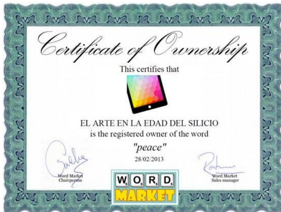
El certificado de propiedad personalizado para "Peace" comprada por El Arte en la Edad del Silicio.

Para concluir buceando entre las ofertas del 'mercado terminológico' no deja de sorprender que las palabras God , Friendship y Mother tengan muy poco valor y el El Arte en la Edad del Silicio pudo comprar por menos de un décimo del presupuesto inicial palabras tan populares como Devil , Flower y Honest . "Hay quienes se la pasan comprando y vendiendo palabras , como meros especuladores. Otros las coleccionan y no quieren venderlas , por más que les hagan ofertas interesantes. Las pujas generalmente tienen lugar para las palabras de moda. Sin embargo, a veces, hay quien compra una palabra en especial sólo para especular y subir su precio ", indica Gache .